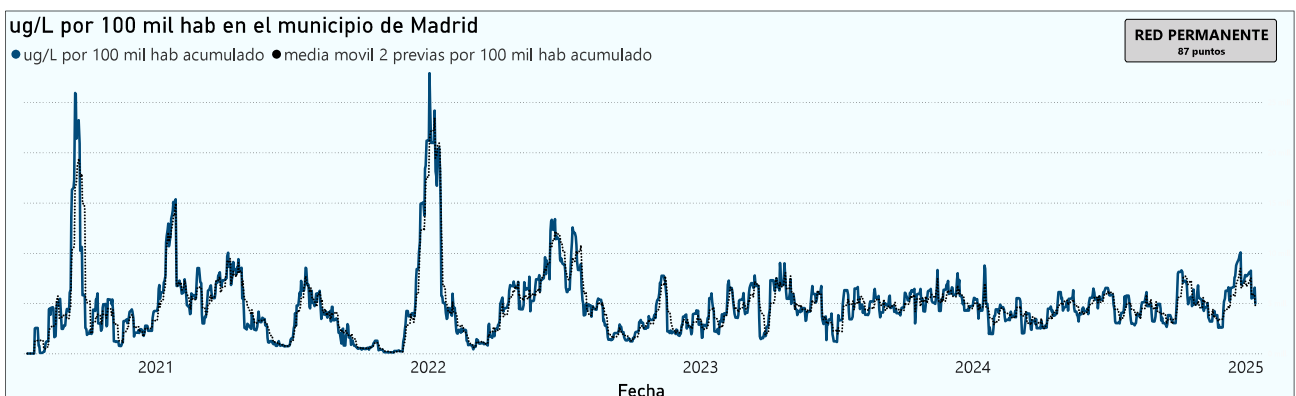
Gráfico 2. Evolución general de la ciudad de Madrid