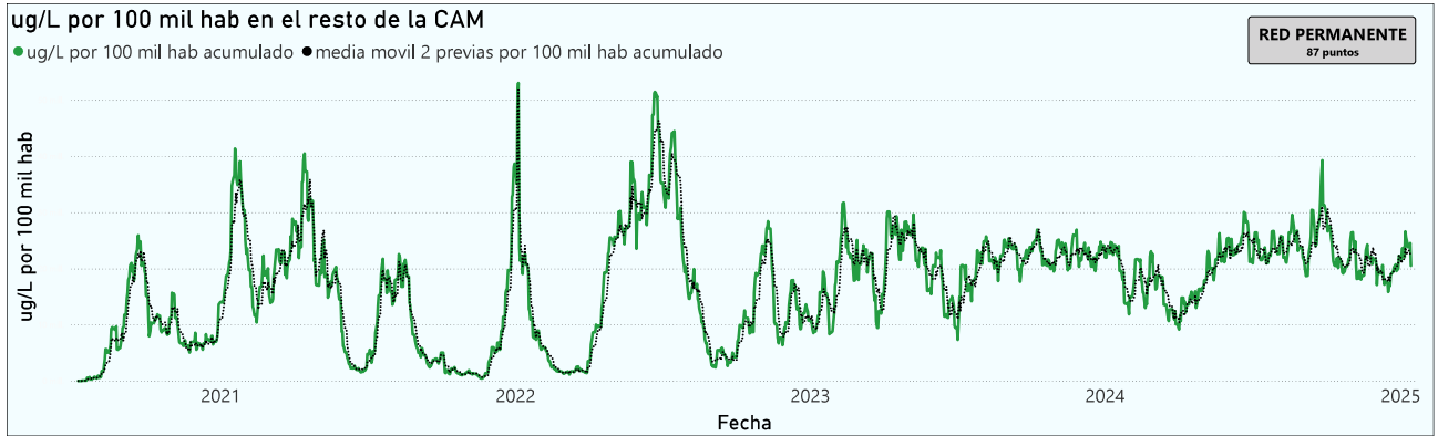
Gráfico 3. Evolución general de la Comunidad de Madrid, excluyendo la capital