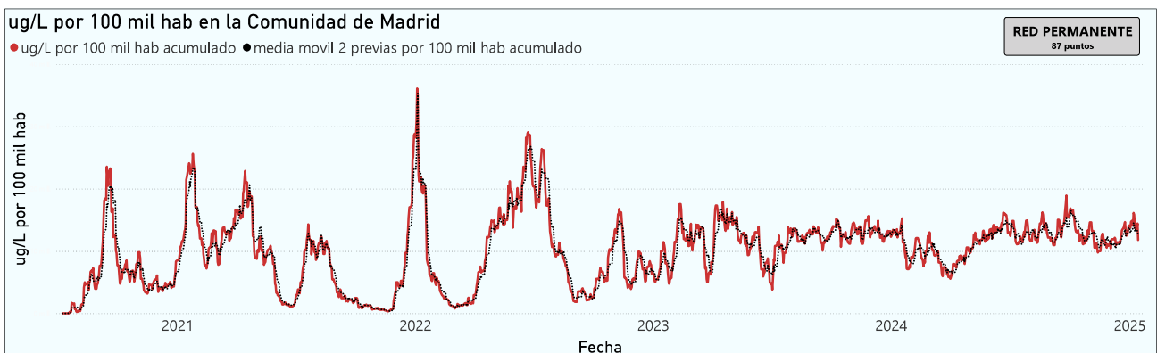
Gráfico 1. Evolución general de la Comunidad de Madrid

*En periodos de lluvia los resultados en el agua residual pueden verse afectados por la dilución de las aguas.