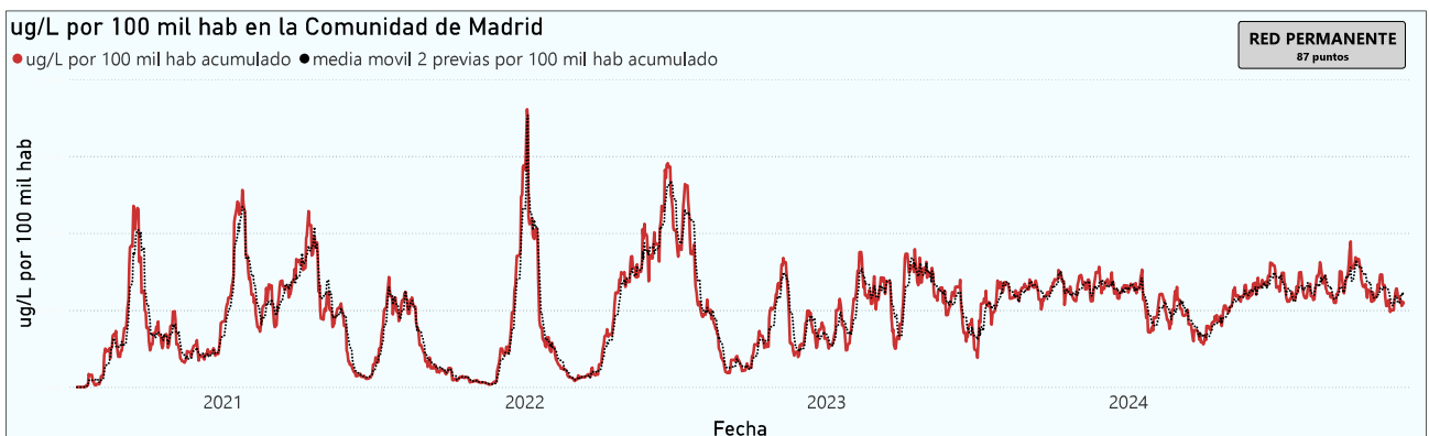
Gráfico 1. Evolución general de la Comunidad de Madrid

*En periodos de lluvia los resultados en el agua residual pueden verse afectados por la dilución de las aguas.