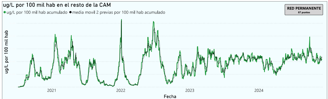
Gráfico 3. Evolución general de la Comunidad de Madrid, excluyendo la capital