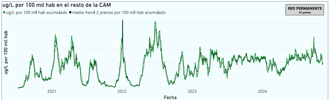
Gráfico 3. Evolución general de la Comunidad de Madrid, excluyendo la capital