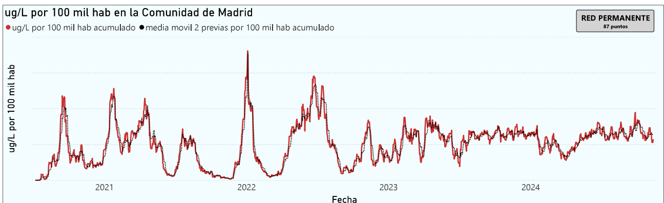
Gráfico 1. Evolución general de la Comunidad de Madrid

*En periodos de lluvia los resultados en el agua residual pueden verse afectados por la dilución de las aguas.