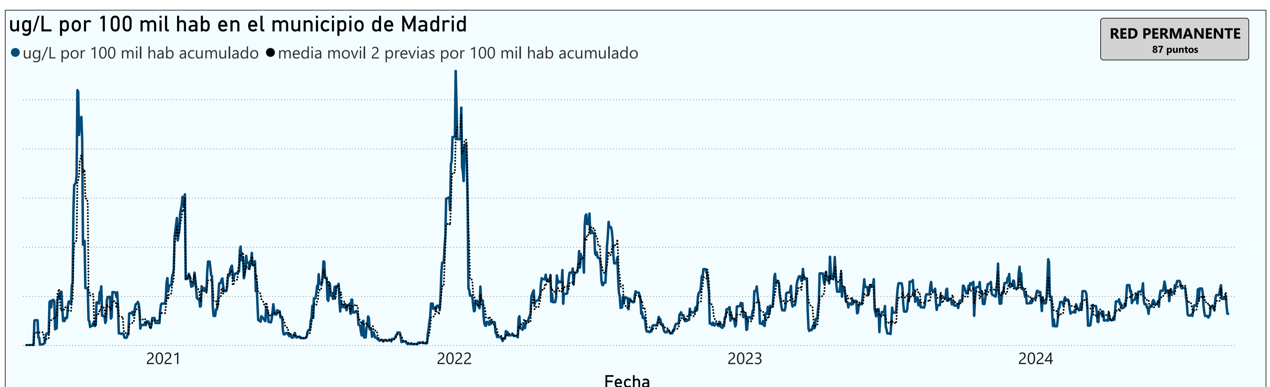
Gráfico 2. Evolución general de la ciudad de Madrid