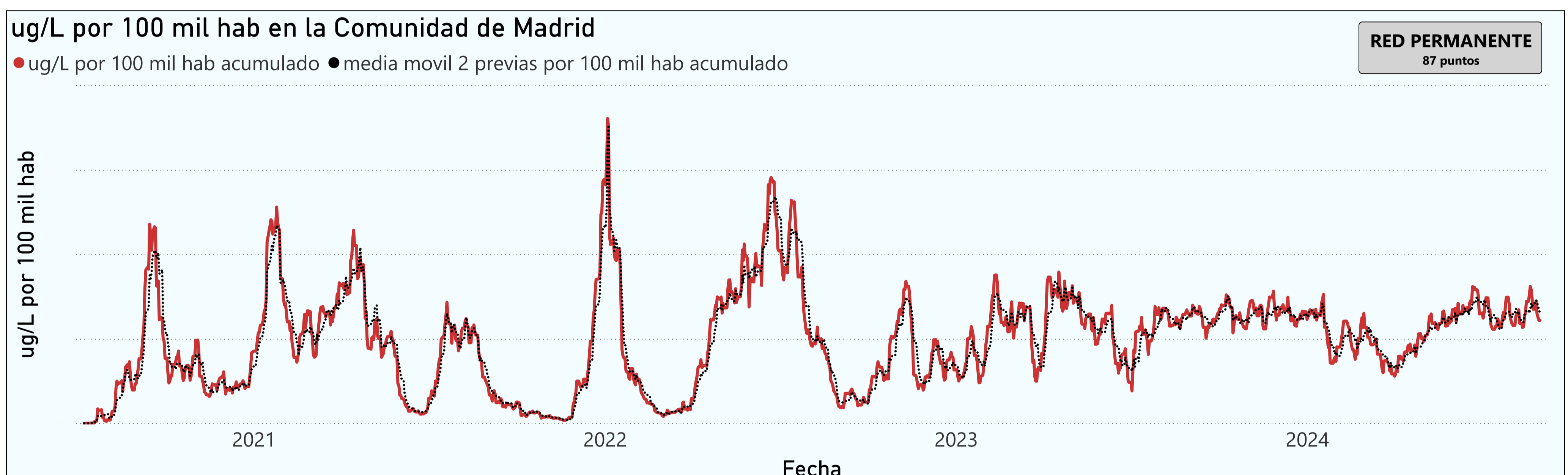
Gráfico 1. Evolución general de la Comunidad de Madrid

*En periodos de lluvia los resultados en el agua residual pueden verse afectados por la dilución de las aguas.