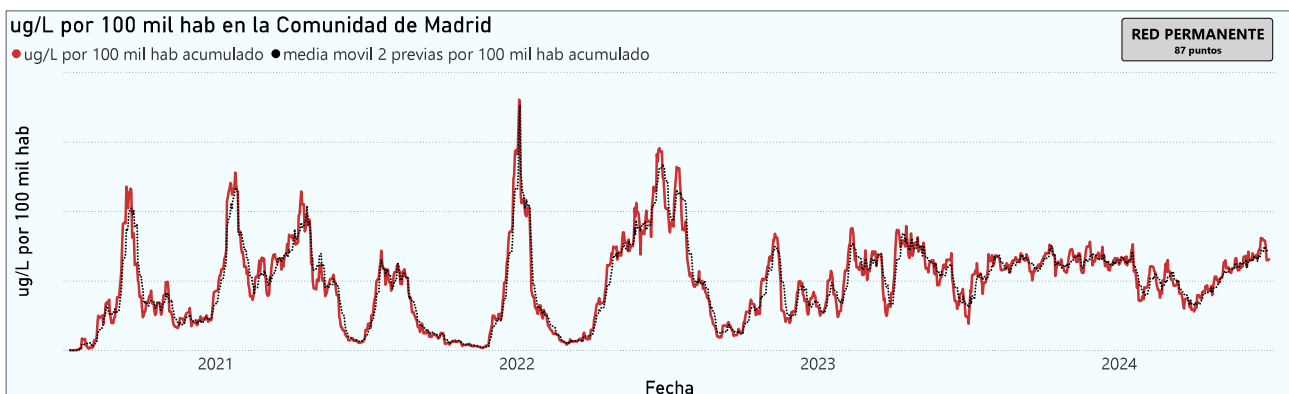
Gráfico 1. Evolución general de la Comunidad de Madrid

*En periodos de lluvia los resultados en el agua residual pueden verse afectados por la dilución de las aguas.