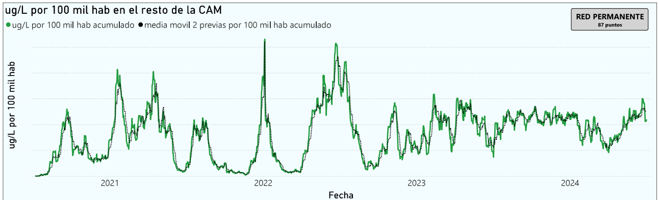
Gráfico 3. Evolución general de la Comunidad de Madrid, excluyendo la capital