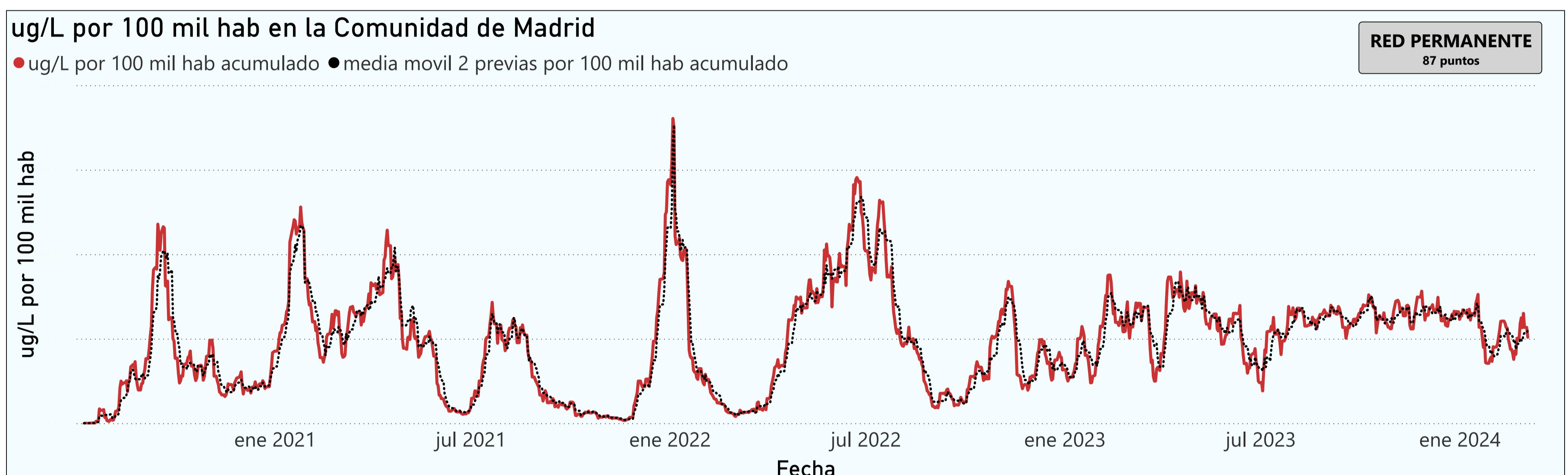
Gráfico 1. Evolución general de la Comunidad de Madrid

*En periodos de lluvia los resultados en el agua residual pueden verse afectados por la dilución de las aguas.