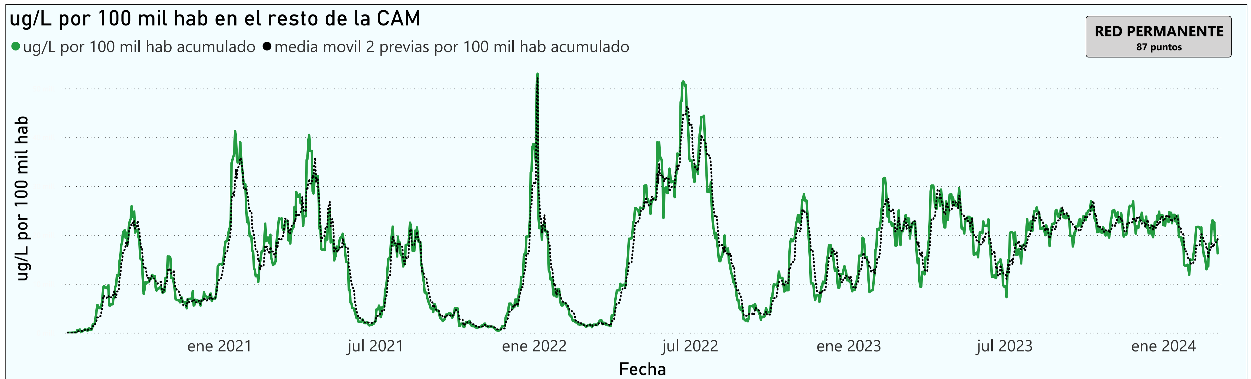
Gráfico 3. Evolución general de la Comunidad de Madrid, excluyendo la capital