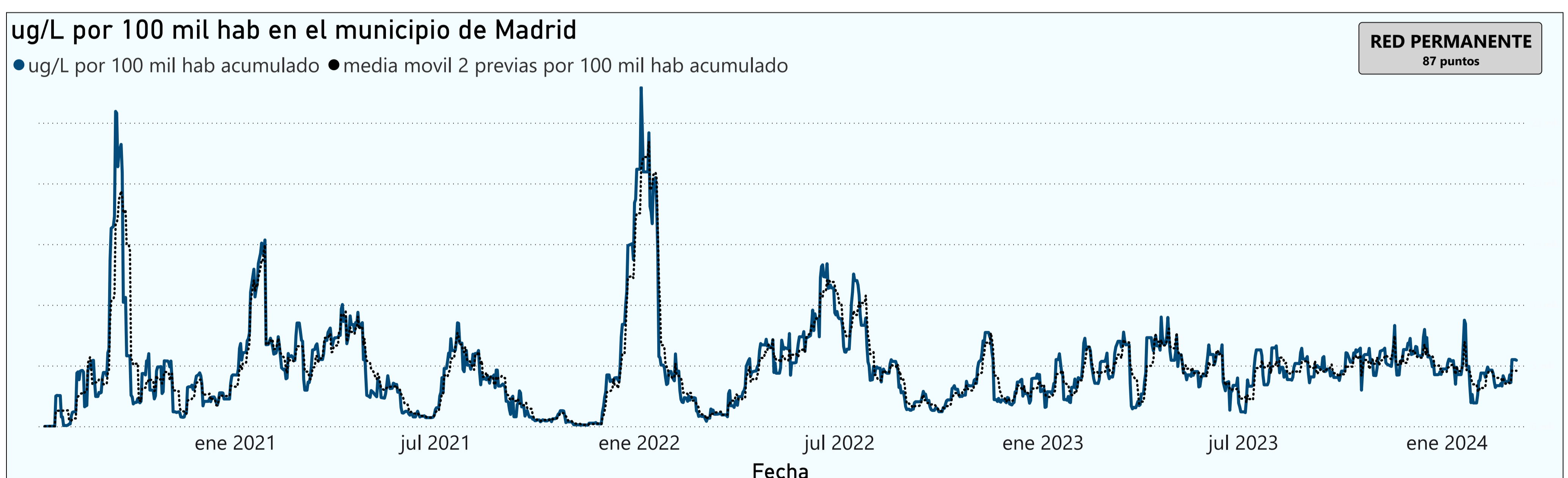
Gráfico 2. Evolución general de la ciudad de Madrid