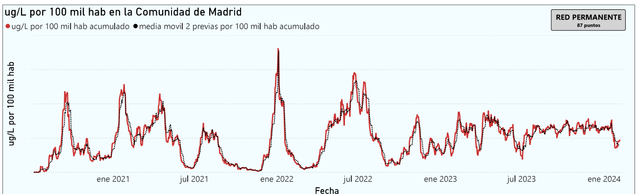
Gráfico 1. Evolución general de la Comunidad de Madrid

*En periodos de lluvia los resultados en el agua residual pueden verse afectados por la dilución de las aguas.