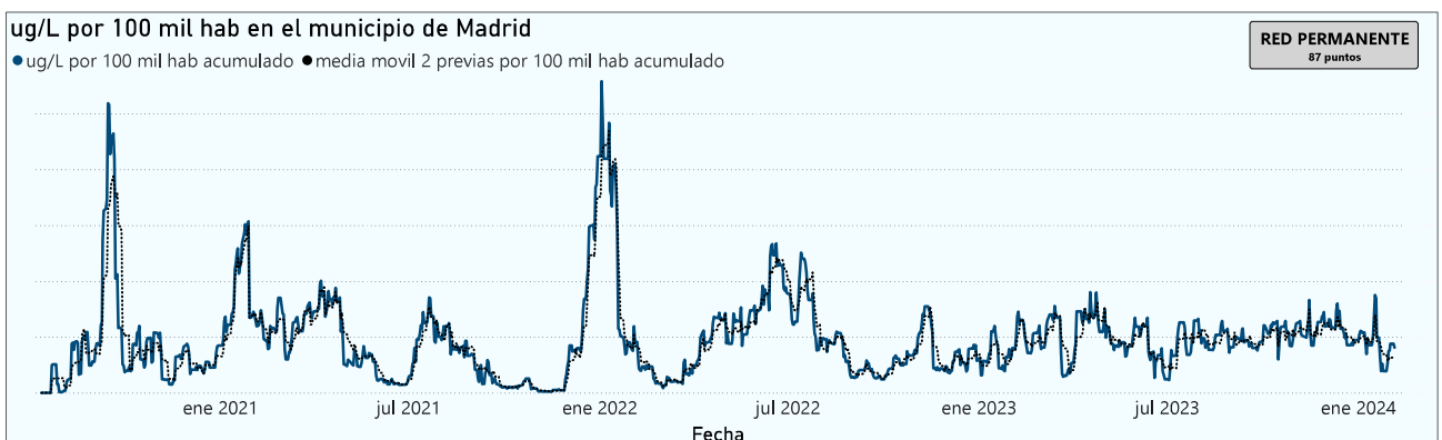
Gráfico 2. Evolución general de la ciudad de Madrid