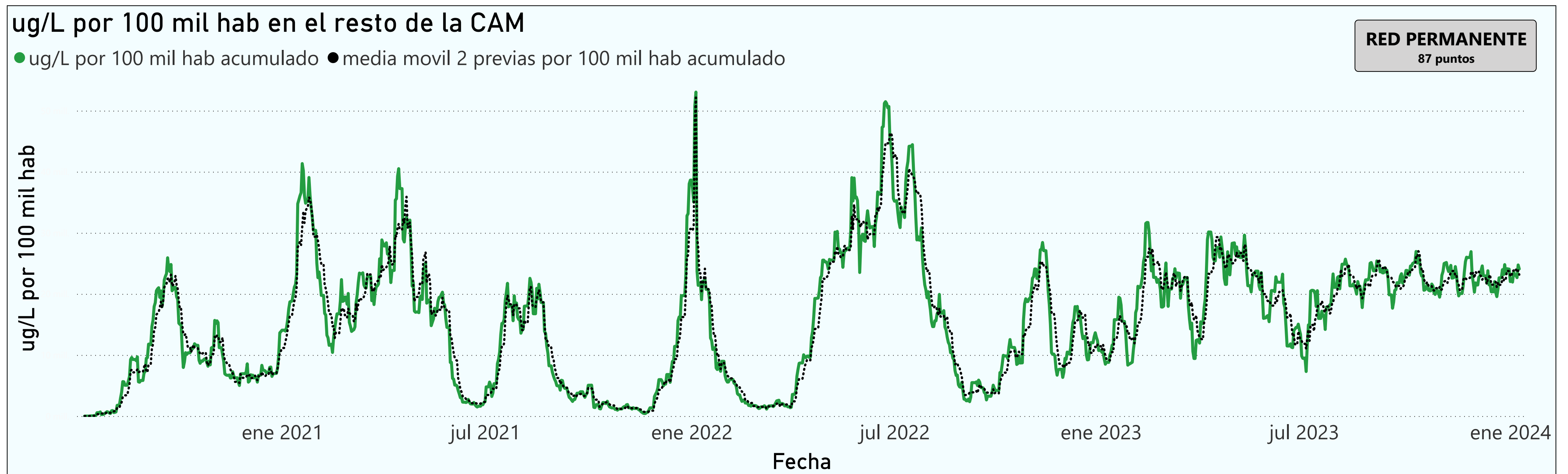
Gráfico 3. Evolución general de la Comunidad de Madrid, excluyendo la capital