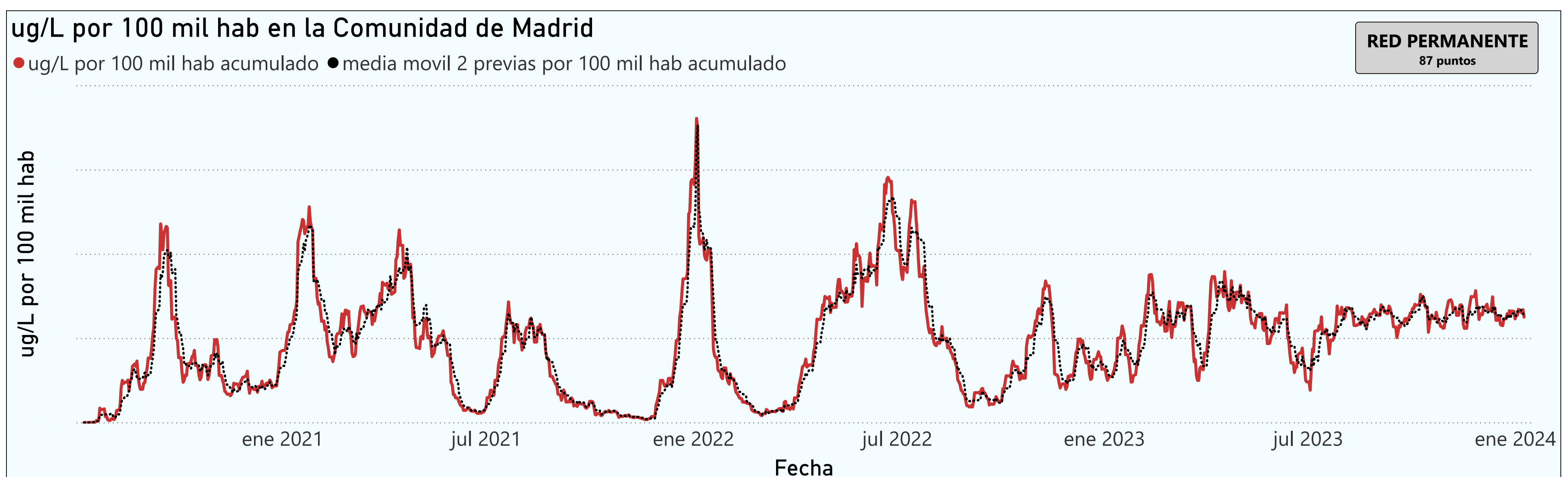
Gráfico 1. Evolución general de la Comunidad de Madrid

*En periodos de lluvia los resultados en el agua residual pueden verse afectados por la dilución de las aguas.