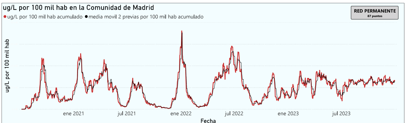
Gráfico 1. Evolución general de la Comunidad de Madrid

*En periodos de lluvia los resultados en el agua residual pueden verse afectados por la dilución de las aguas.