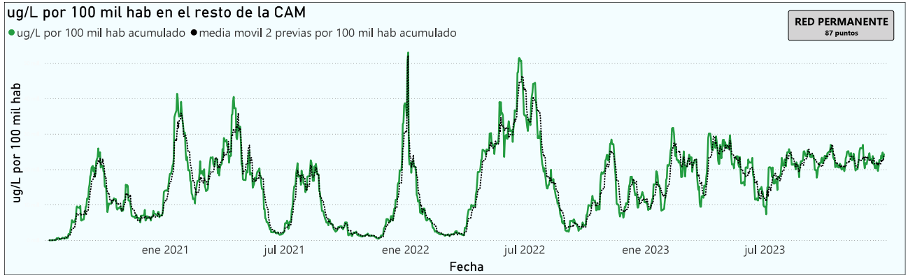
Gráfico 3. Evolución general de la Comunidad de Madrid, excluyendo la capital