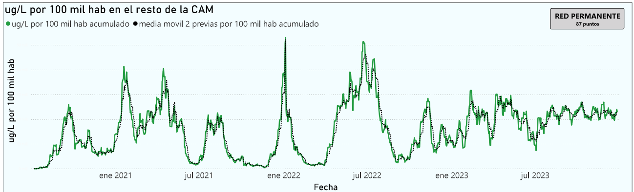
Gráfico 3. Evolución general de la Comunidad de Madrid, excluyendo la capital