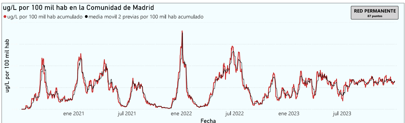
Gráfico 1. Evolución general de la Comunidad de Madrid

*En periodos de lluvia los resultados en el agua residual pueden verse afectados por la dilución de las aguas.