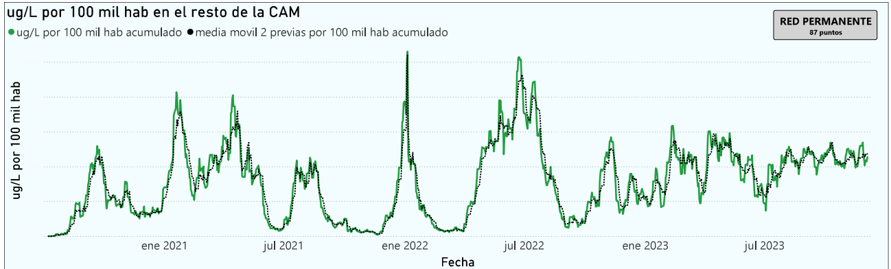
Gráfico 3. Evolución general de la Comunidad de Madrid, excluyendo la capital