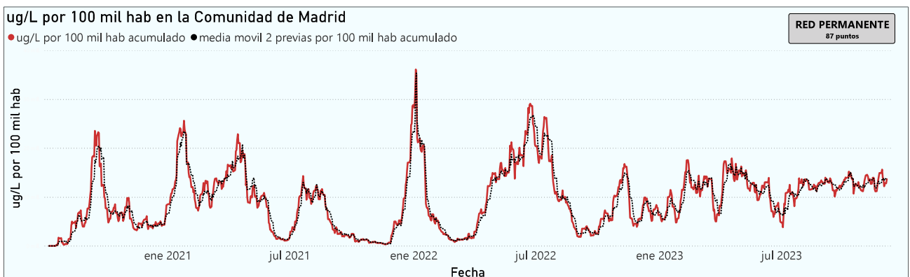
Gráfico 1. Evolución general de la Comunidad de Madrid

*En periodos de lluvia los resultados en el agua residual pueden verse afectados por la dilución de las aguas.