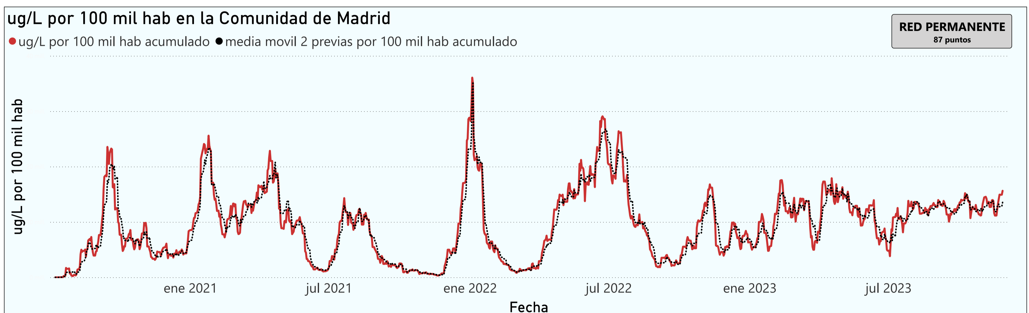
Gráfico 1. Evolución general de la Comunidad de Madrid

*En periodos de lluvia los resultados en el agua residual pueden verse afectados por la dilución de las aguas.