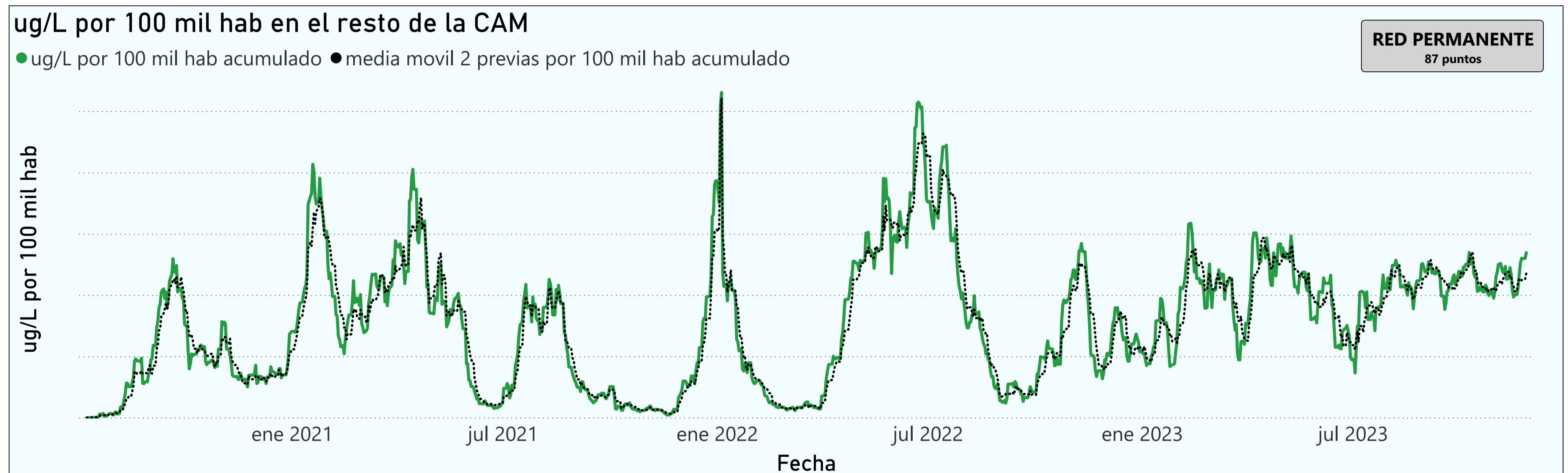
Gráfico 3. Evolución general de la Comunidad de Madrid, excluyendo la capital