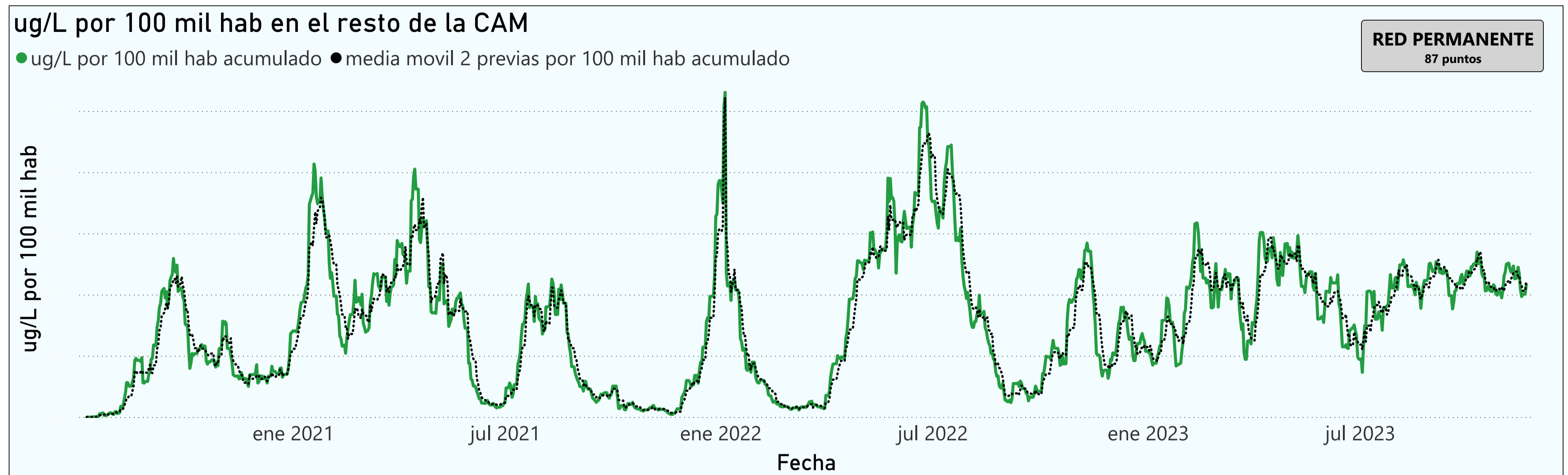
Gráfico 3. Evolución general de la Comunidad de Madrid, excluyendo la capital