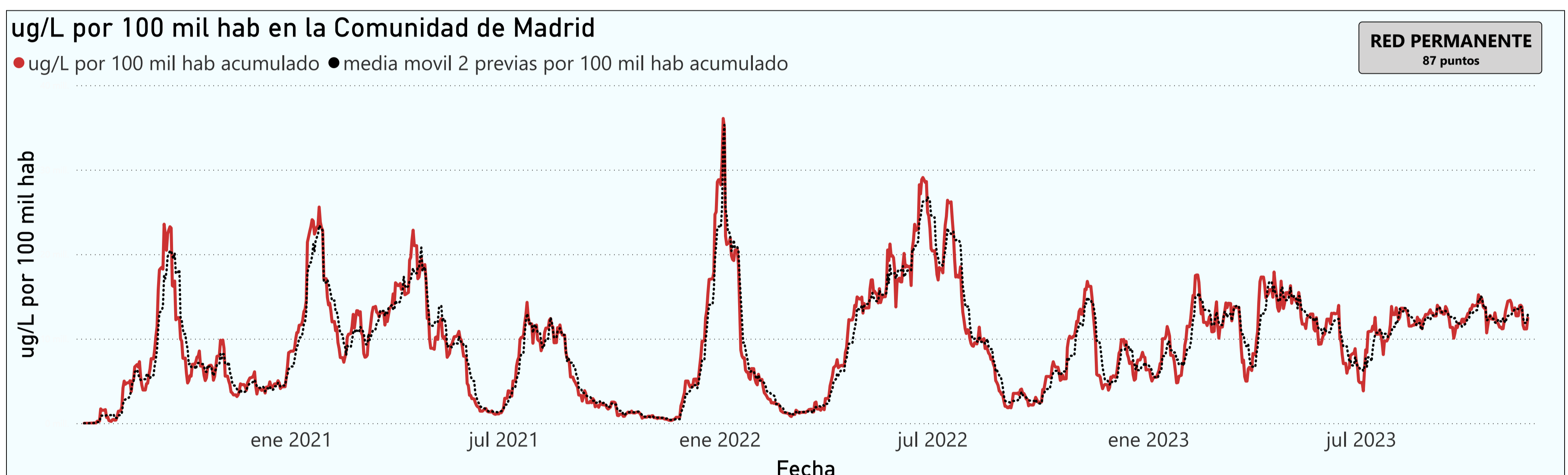
Gráfico 1. Evolución general de la Comunidad de Madrid

*En periodos de lluvia los resultados en el agua residual pueden verse afectados por la dilución de las aguas.